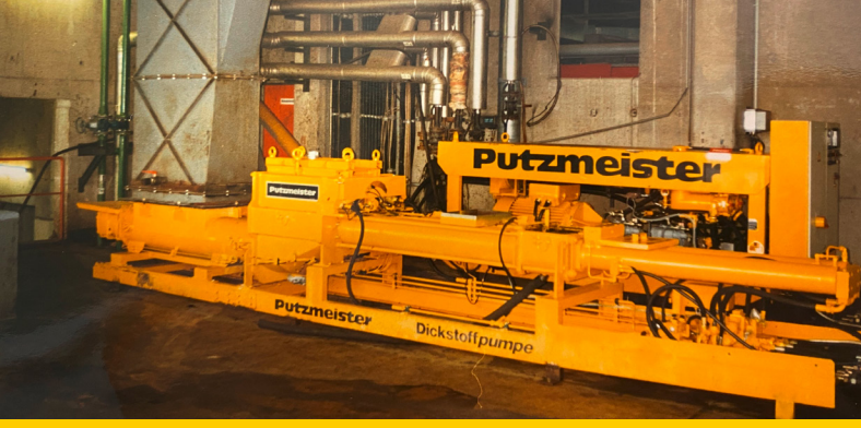
1987'den kalma bir Putzmeister kalın madde pompası