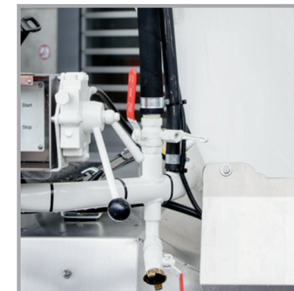
Bessere Zugänglichkeit und mehr Freiraum, selbst bei kurzen Radständen, durch die in den Leiterhalter integrierte Wasserleitung.