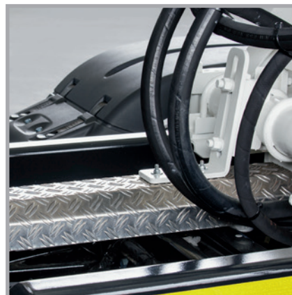
Die flexible Gelenkwellenabdeckung ist hochwertig und im Wartungsfall schnell zu demontieren.