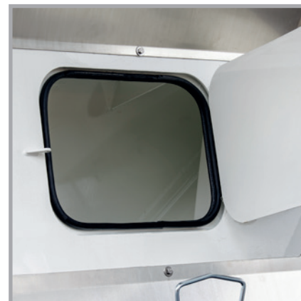
Sicherer Transport des mitgeführten Werkzeugs durch leicht zugängliche, integrierte Werkzeugbox.