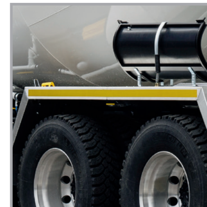
Zeit sparen ohne auf Sicherheit zu verzichten durch einfaches Anbringen von Sicherheits-Applikationen wie bspw. des Reflektionsbandes auf den Aluminium-Kotflügeln mit neuer Form.