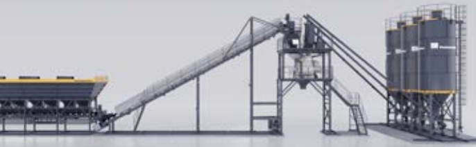
MT 1.0 BANDE DE TRANSPORT INCLINÉE & BACS EN LIGNE