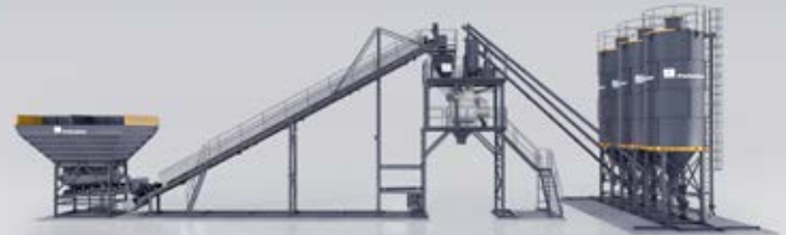
CINTA TRANSPORTADORA INCLINADA Y TOLVAS COMPARTIMENTADAS MT 1.0