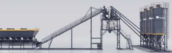
CINTA TRANSPORTADORA INCLINADA Y TOLVAS EN LÍNEA MT 1.0