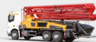
BOMBA DE HORMIGÓN SOBRE CAMIÓN