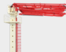
PLUMA DE DISTRIBUCIÓN FIJA