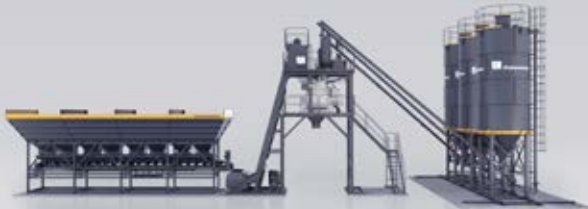
CONTENEDOR Y TOLVAS EN LÍNEA MT 1.0