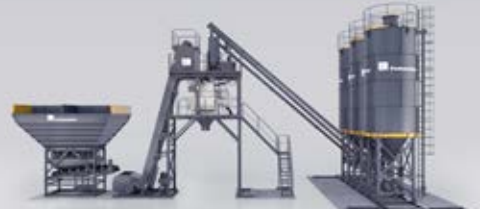
CONTENEDOR Y TOLVAS COMPARTIMENTADAS MT 1.0