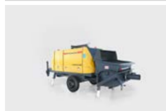
POMPE À BÉTON STATIONNAIRE 20 à 100 m 3 /h