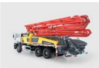
POMPE À BÉTON AUTOMOTRICE Portée horizontale : 31,4 à 37,6 m Portée verticale : 35,6 à 41,6 m