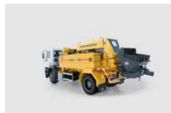
POMPE MOBILE 40 à 70 m 3 /h