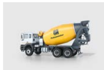
CAMION-MALAXEUR 6, 7, 8 et 10 m 3