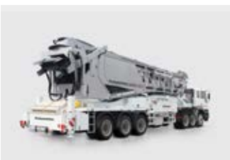
TELEBELT Portée horizontale : 31,8 à 61 m Portée verticale : 16,78 à 34,70 m