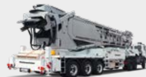
CONVOYEUR MOBILE À BANDE TELEBELT