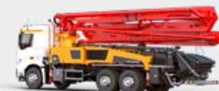
POMPE À BÉTON AUTOMOTRICE